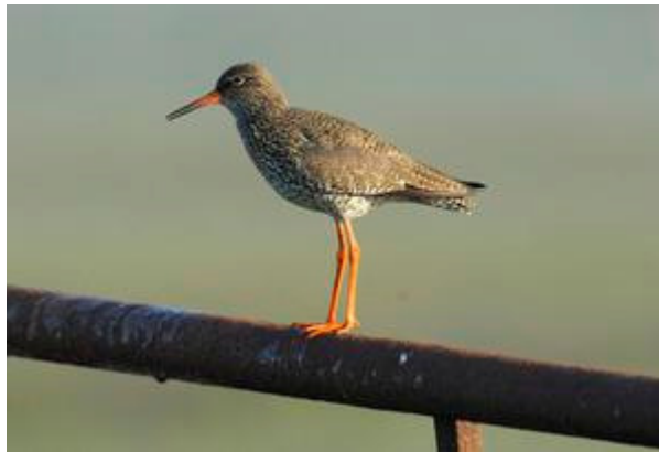
Tureluur alarmeert vanaf boerenhekje.

Het geheim van de Ronde Hoep is niet zo moeilijk te doorgronden. Rond de veertig boerenbedrijven liggen in een cirkel rond een weidevogelreservaatje van 180 hectare op een totaal aan 900 hectare. Bijna alle boeren zijn aangesloten bij de agrarische natuurvereniging De Amstel en doen mee aan weidevogelbeheer. Ze beschermen nesten en ze maaien later, met het oog op de overlevingskans van gruttokuikens. Het opbrengstverlies krijgen ze vergoed. Ook het reservaat van Landschap Noord-Holland wordt door de boeren beheerd. Hier is de waterstand iets hoger en wordt nog later gemaaid.